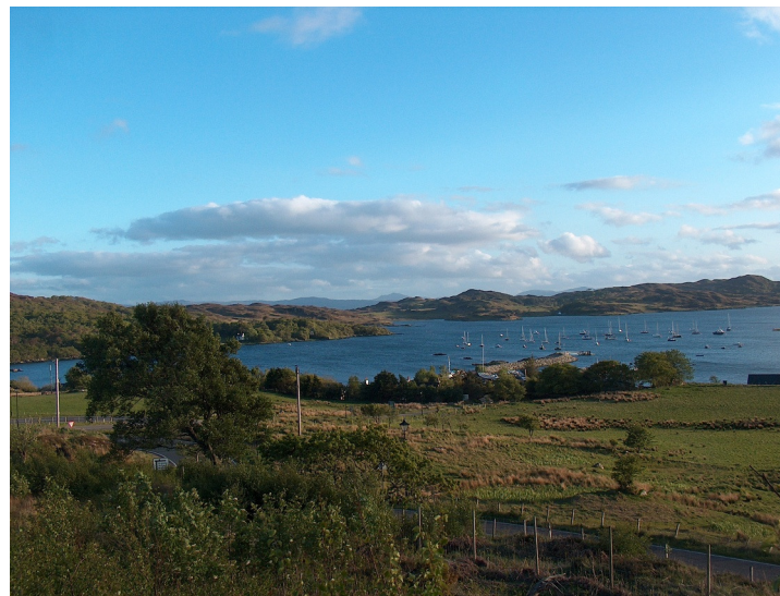
Blick über die Bucht von Arisaig