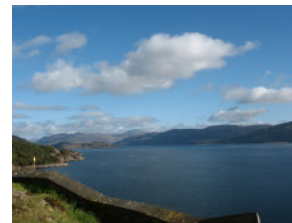
Bei Kyle of Lochalsh

Ausgeruht, nach einem guten Frühstück auf See erreichen wir um ca. 11.30. Uhr Zeebrugge. Danach Rückreise in Saarland—Rückkunft ca. 22.00 Uhr