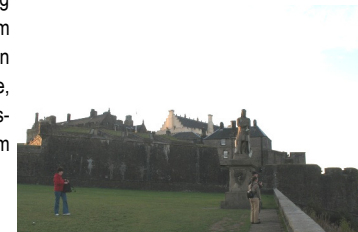
Am Stirling Castle

Unsere Route führt heute in das „Tal der Tränen“ - Glen Coe - einem landschaftlich einmalig schönem Gebiet. Über Rannoch Moor fahren wir zum Drovers Inn, das seit über 300 Jahren nahezu unverändert als Gasthaus betrieben wird. Anschließend Weiterfahrt wieder entlang des Loch Lomond über Stirling und Stirling Castle, dem Schloss, in dem Maria Stuart einst zur Königin von Schottland gekrönt wurde, nach Dunfermline. Abendessen und Übernachtung im Raum Dunfermline.